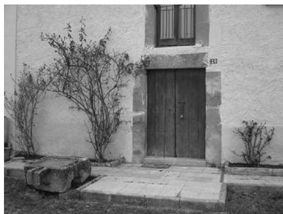
Façana de Cal Baixiner