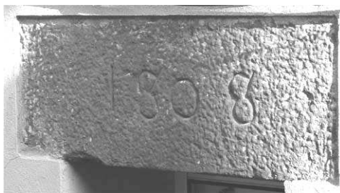
Llinda d'una obertura

van servir per cancel·lar els deutes amb el Tinai i el mateix Malagarriga. La història de cal Cistelleret s'acaba aquí ja que els compradors van obrir una obertura a la paret mitgera que separava les dues cases, que es trobaven adossades d'esquena a esquena, i de dues cases en van fer una de més gran; l'actual cal Mariano. De cal Cistelleret, que tenia l'entrada a la banda nord, donant al carreret, en queda com a vestigi una llinda d'una finestra, que porta la data 1802, una foto de la qual il·lustra el present article.