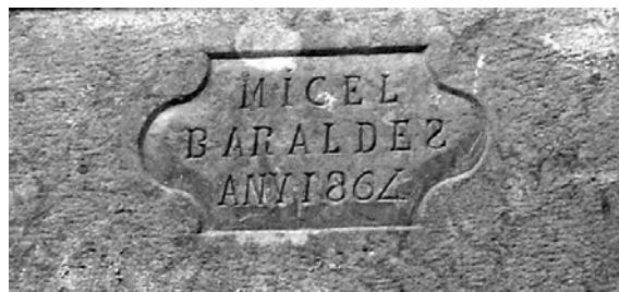
Llinda d'una finestra