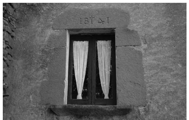
Llinda de la finestra