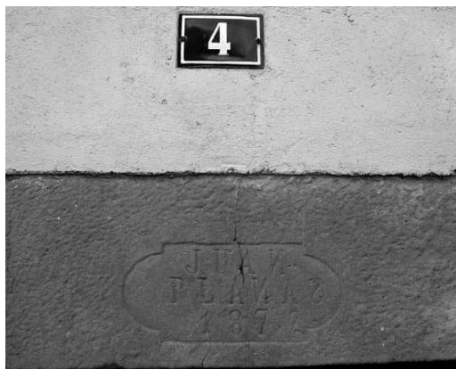
Llinda de Cal Canyon