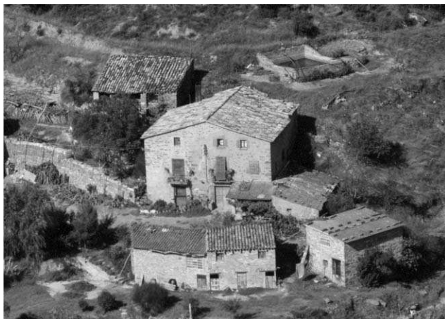
Vista aèria de Cal Tico Vell