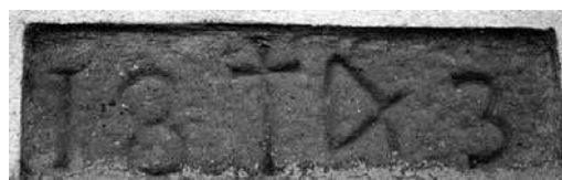
Llinda d'una finestra