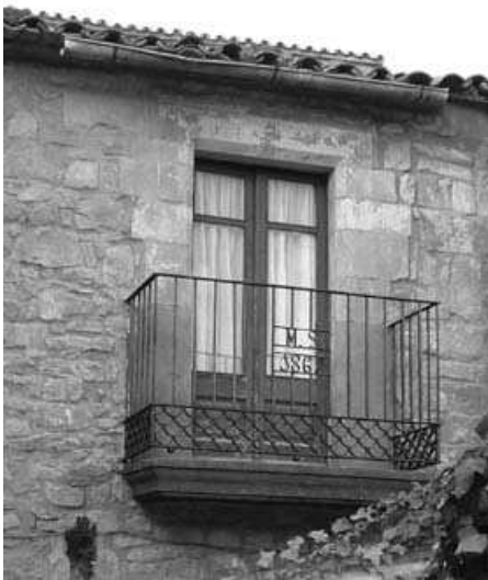
Balcó de la Gabriela de Baix, datat el 1869