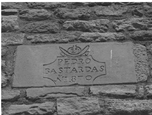
Pedra amb inscripció, a la façana sud de la casa