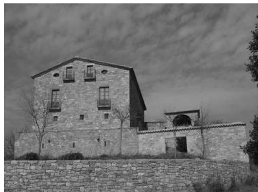
Vista general de la façana sud