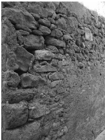
Paret de cal Cisteller