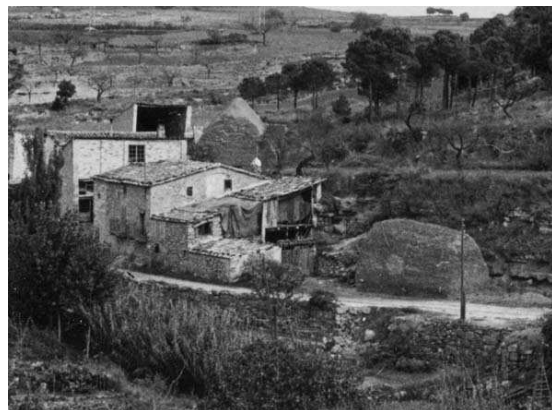
Ca l'Agustí (c. 1960)