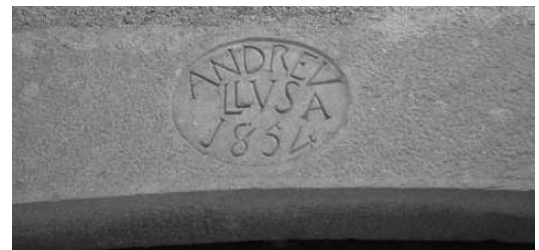
Linda del portal principal