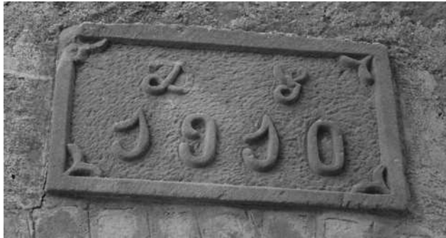
Llinda de la Sala de Cal Tinai

adquirir per 95 pessetes un tros de 8.640 pams quadrats annex a casa seva. Va invertir els seus estalvis i va fer edificar sobre el terreny una construcció de dos pisos. La va estrenar l'any 1910. Va llogar una part de la planta baixa a l'Ajuntament per utilitzar-la com aula escolar. Al darrere es va obrar un petit pis pel mestre resident de l'escola. L'escola va funcionar fins a finals de 1961, quan es va traslladar a l'edifici nou. La resta de la planta era una estança força gran que es va convertir en la "Sala Tinai", durant molts anys el centre de les activitats d'oci de Fals. La Sala es va equipar amb una pianola accionada amb maneta que servia per amenitzar els balls que s'hi organitzaven amb regularitat. Destacaven els balls de la Festa Major i de diades assenyalades, com per exemple, Reis o Cap d'Any. En aquestes ocasions especials es llogava una orquestra de fora, que oferia música en directe pels balladors. Els balls s'anunciaven mitjançant cartells i la Sala va convertir-se en un focus d'atracció del jovent dels pobles de la rodalia. La Sala també era el lloc de reunió idoni quan calia discutir algun afer d'interès del poble.