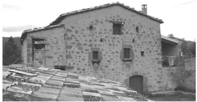
Cal Tico Nou