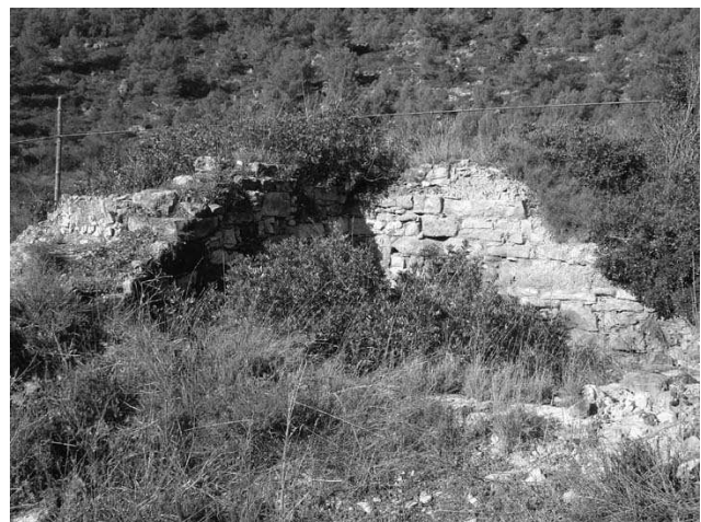
Ruïnes de Cal Ramon d'Oliveres