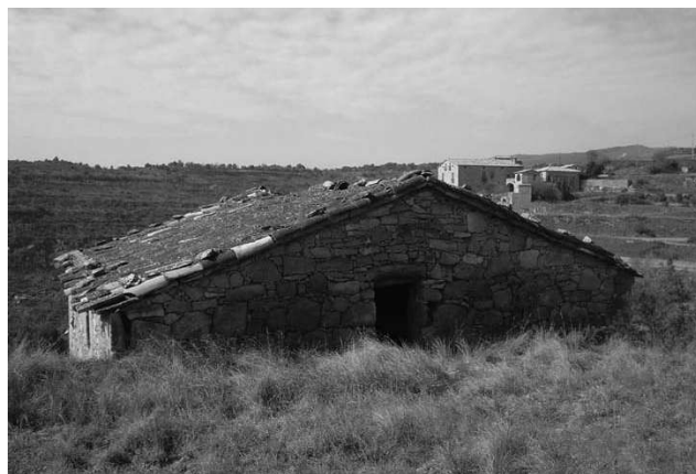
Vista posterior de Cal Gravat