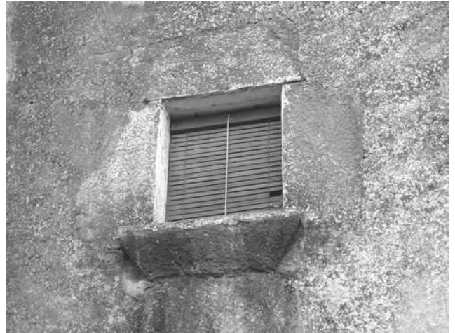
Finestra de Cal Caietano