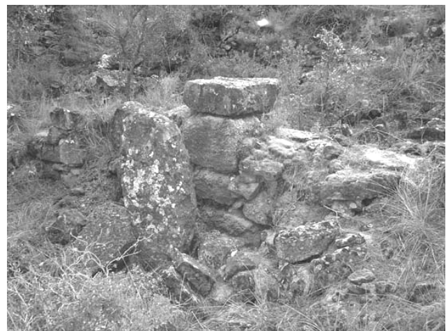
Ruïnes de Cal Pere Negre