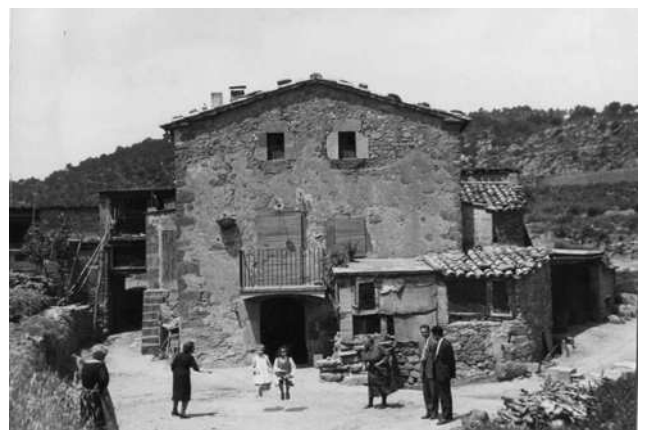
Cal Lluís, 1959