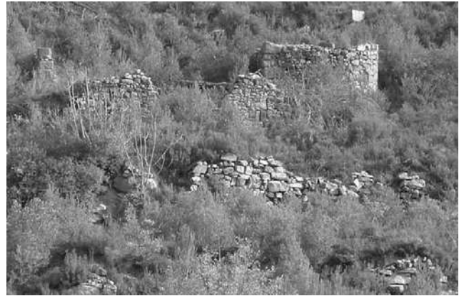
Ruïnes de Cal Colilles

entre les dues cases no supera de gaire els 100 metres. Josep Colilles Junyent va ser una persona que va tenir una longevitat extraordinària per l'època; va viure fins a l'edat de 91 anys. Va ser enterrat el dia 13 d'agost de 1889.