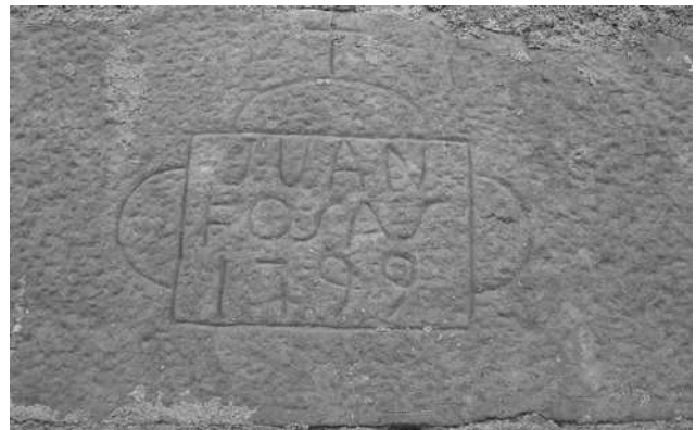
Llinda de la finestra