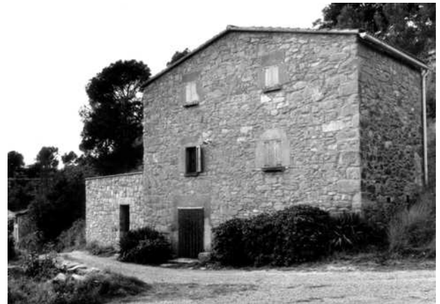
Façana de Cal Xic

persona o una bèstia. En va pagar 480 pessetes al comptat. Va començar a edificar la casa tot seguit i al cap de dos anys ja la tenia acabada, ja que la llinda principal està datada el 1878. En una declaració catastral del 1893, és descrita com una casa de planta baixa, un pis i golfes, de 42 pams de façana i 22 pams de fondària. La casa s'anomenava cal Xic del Tinai.