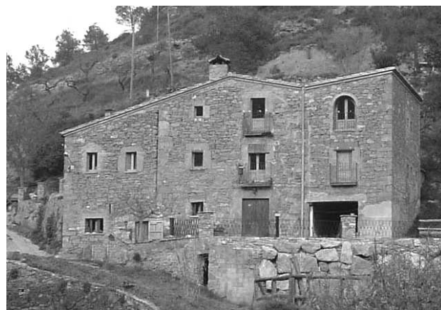
Vista de la façana sud occidental de Cal Mongia