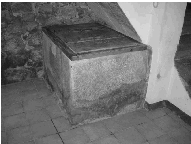
Pica d'oli de Cal Gardela