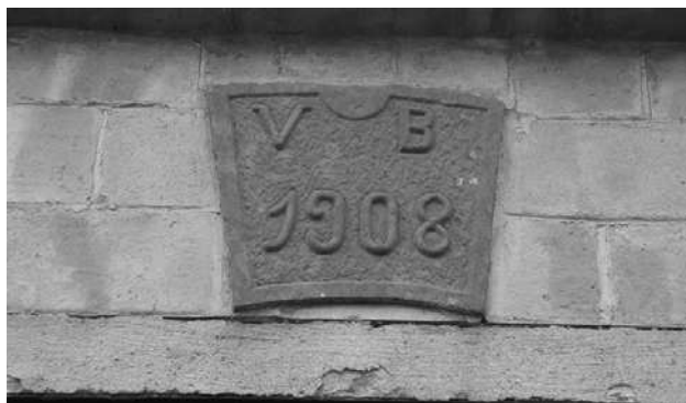
Llinda de principis de segle de Cal Gardela