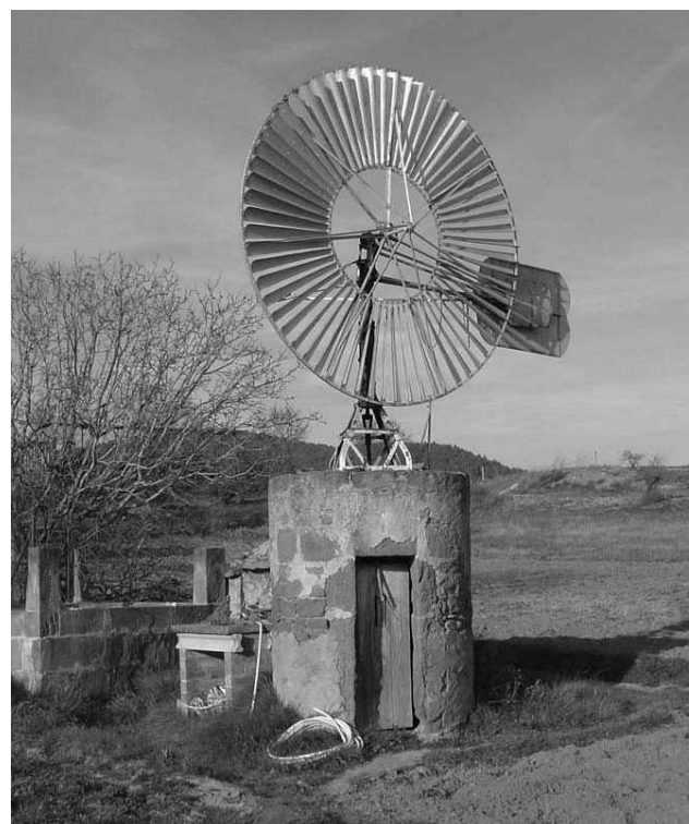
Moli de Cal Janet